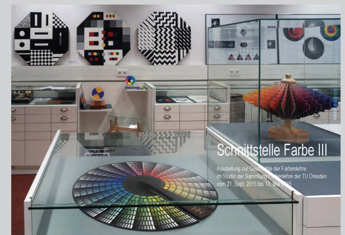
Ausstellung „Schnittstelle Farbe III“ 2015-2016 im Studio der Sammlung Farbenlehre