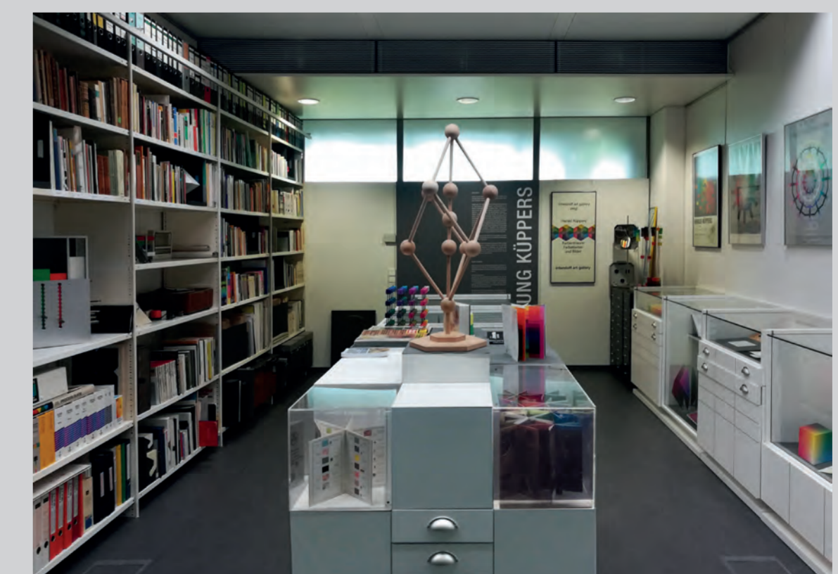
Im Fokus des 12. Farbenforums 2019 stand die Übernahme der Privatsammlung des Drucktechnikers und Farbsystemmatikers Harald Küppers in neue Räume der Sammlung Farbenlehre.