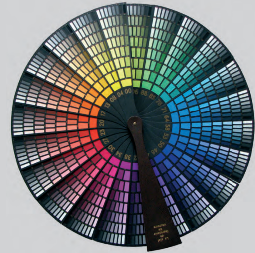
Farbenfächer, entworfen 1922 von Otto Prase, hergestellt 1935 bei Paul Baumann in Aue/ Sa.

Nach Umzug der Sammlung und Wiedereröffnung 2019 in den neuen Räumen bestimmten zunehmend Erfordernisse der digitalen Aufbereitung und Archivierung den weiteren Aufbau der Sammlung und führten 2021 auch zur Einbindung ausgewählter Archivalien in die neue Online-Sammlungsdatenbank DAPHNE der Kustodie: Universitäts Sammlungen Online : https://sammlungen.tu-dresden.de/