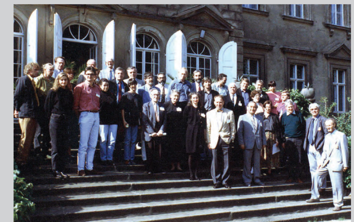
Die Teilnehmer des 1. Dresdner Farbenforums 1992 im Schloss Gaußig (Gästehaus TU Dresden)