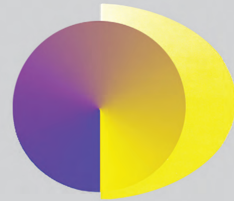
Logo des Dresdner Farbenforums (Entwurf: E. Bendin/ F. Trüstedt, 2001)

Eckhard Bendin: Schnittstelle Farbe. Beiträge zur Farbenlehre im Mitteldeutschen Raum Lehrtafeln zu Leben und Werk von Personen der Geschichte. Ergänzungstafel. Dresden 2022