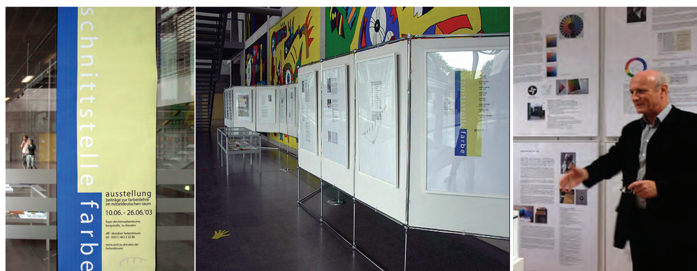
Sonderausstellung „Schnittstelle Farbe - Beiträge zur Farbenlehre im Mitteldeutschen Raum 2003 im Hörsaalzentrum der TU Dresden