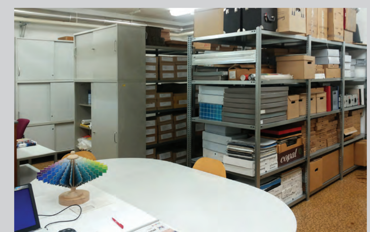
Provisorisches Kellerdepot der Sammlung Farbenlehre 2014