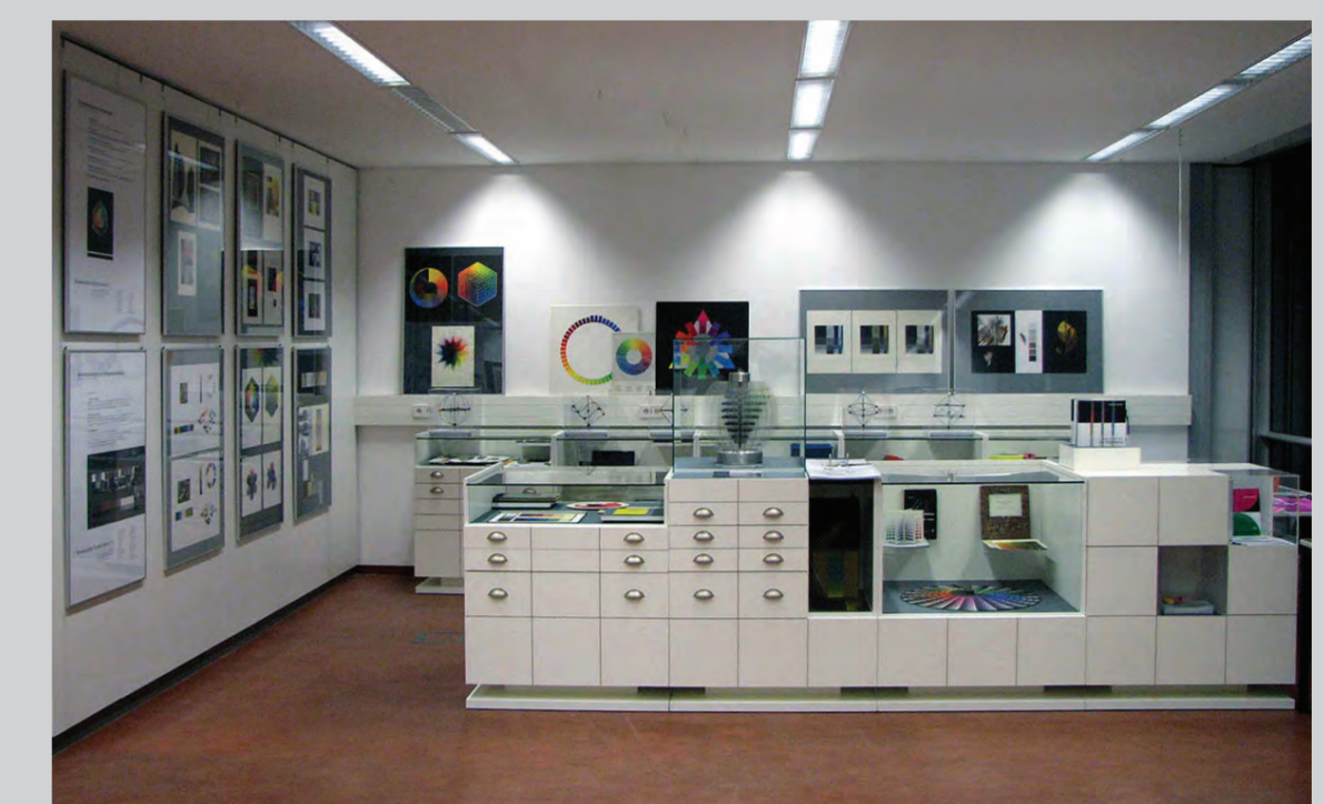
Eröffnungsausstellung zur Farbenlehre Eckhard Bendin 2011 im Studio der Sammlung