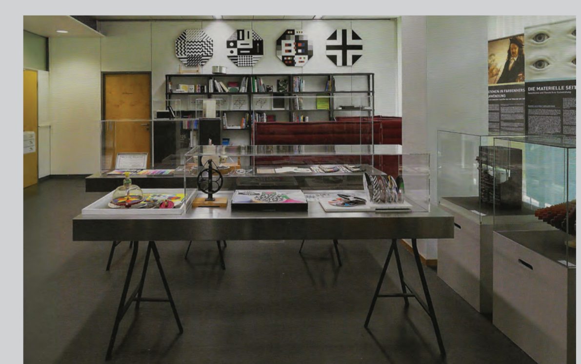
Das Schaudepot der Sammlung Farbenlehre in den neuen Räumen 2021