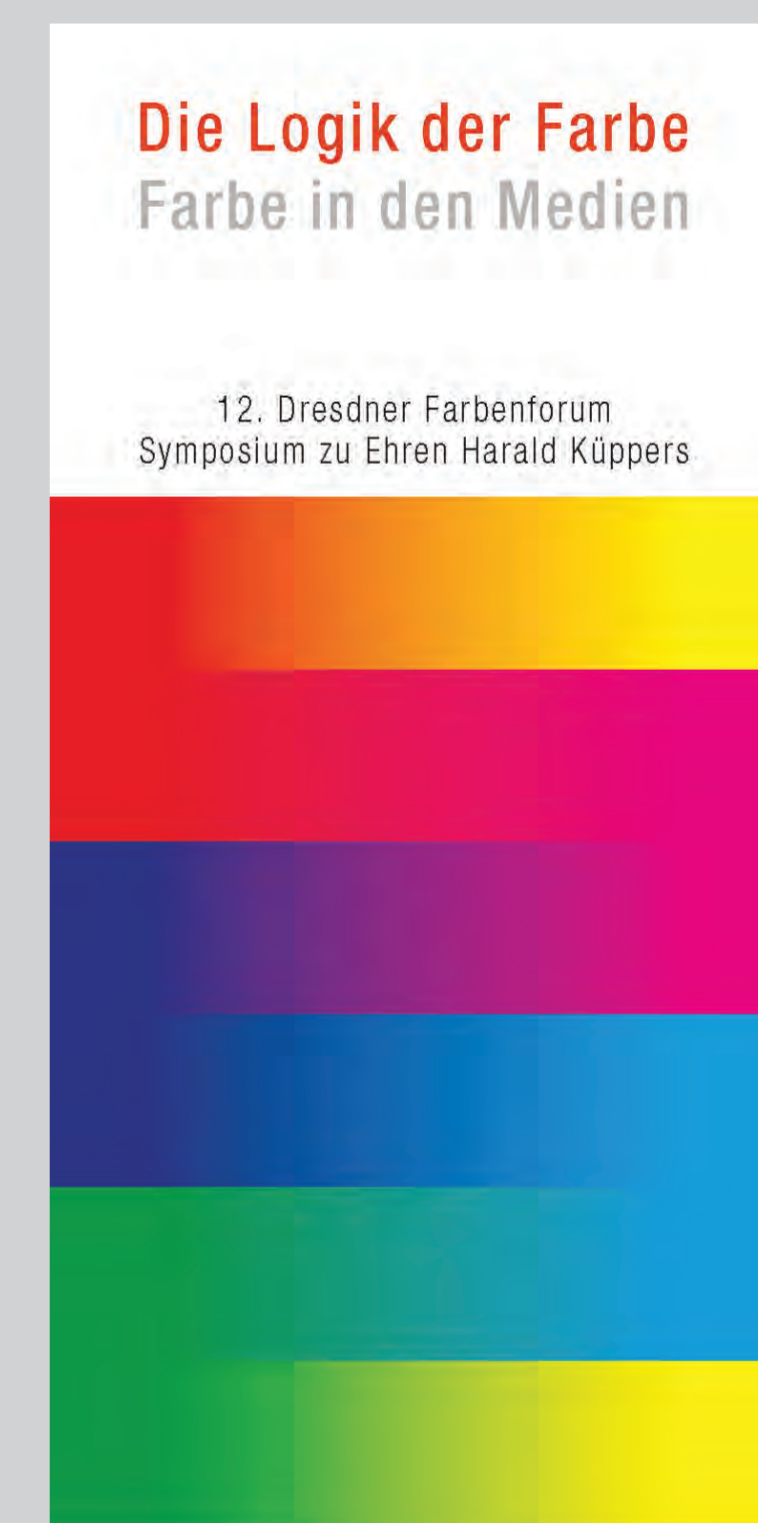
Flyer zum 12. DFF 2019 (Entwurf Th. Kanthak)